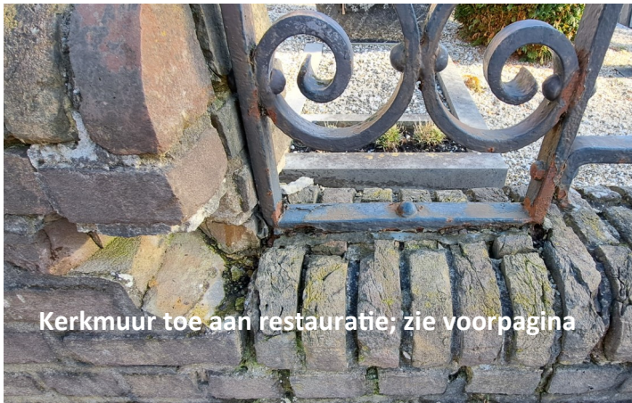
Kerkmuur toe aan restauratie; zie voorpagina